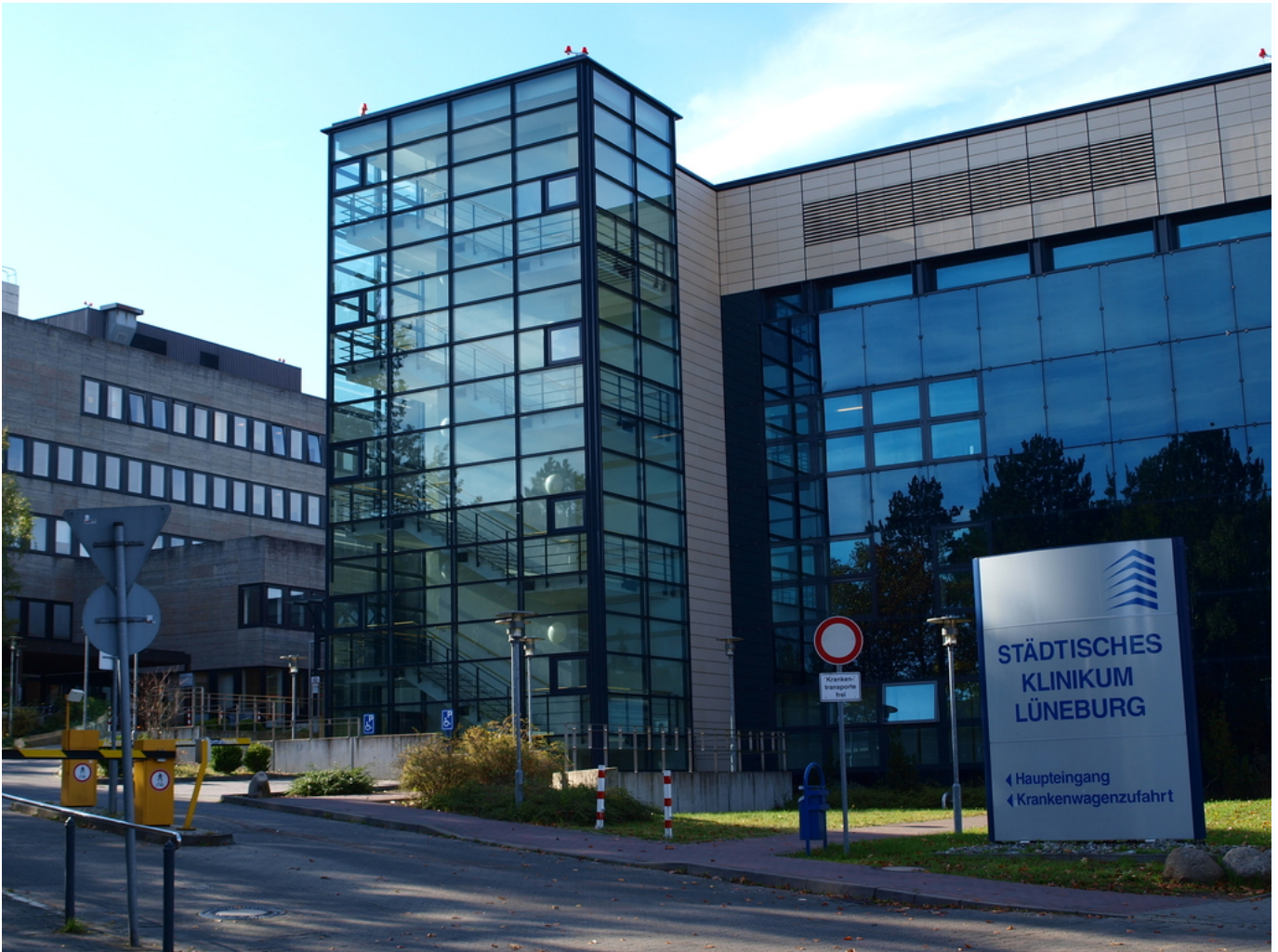
Abbildung: Städtisches Klinikum Lüneburg gemeinnützige GmbH

Mit der Veröffentlichung des nun vorliegenden dritten Qualitätsberichtes möchte das Städtische Klinikum Lüneburg nicht nur seiner gesetzlichen Verpflichtung der Veröffentlichung nachkommen, sondern gleichzeitig Patientinnen und Patienten und anderen Kunden wie niedergelassenen Ärztinnen und Ärzten, verlegenden oder kooperierenden Krankenhäusern, Krankenkassen und Versicherungen, Kooperationspartnern und Lieferanten und nicht zuletzt auch allen Mitarbeiterinnen und Mitarbeitern in transparenter Weise darstellen, was in unserem Klinikum geleistet wird.