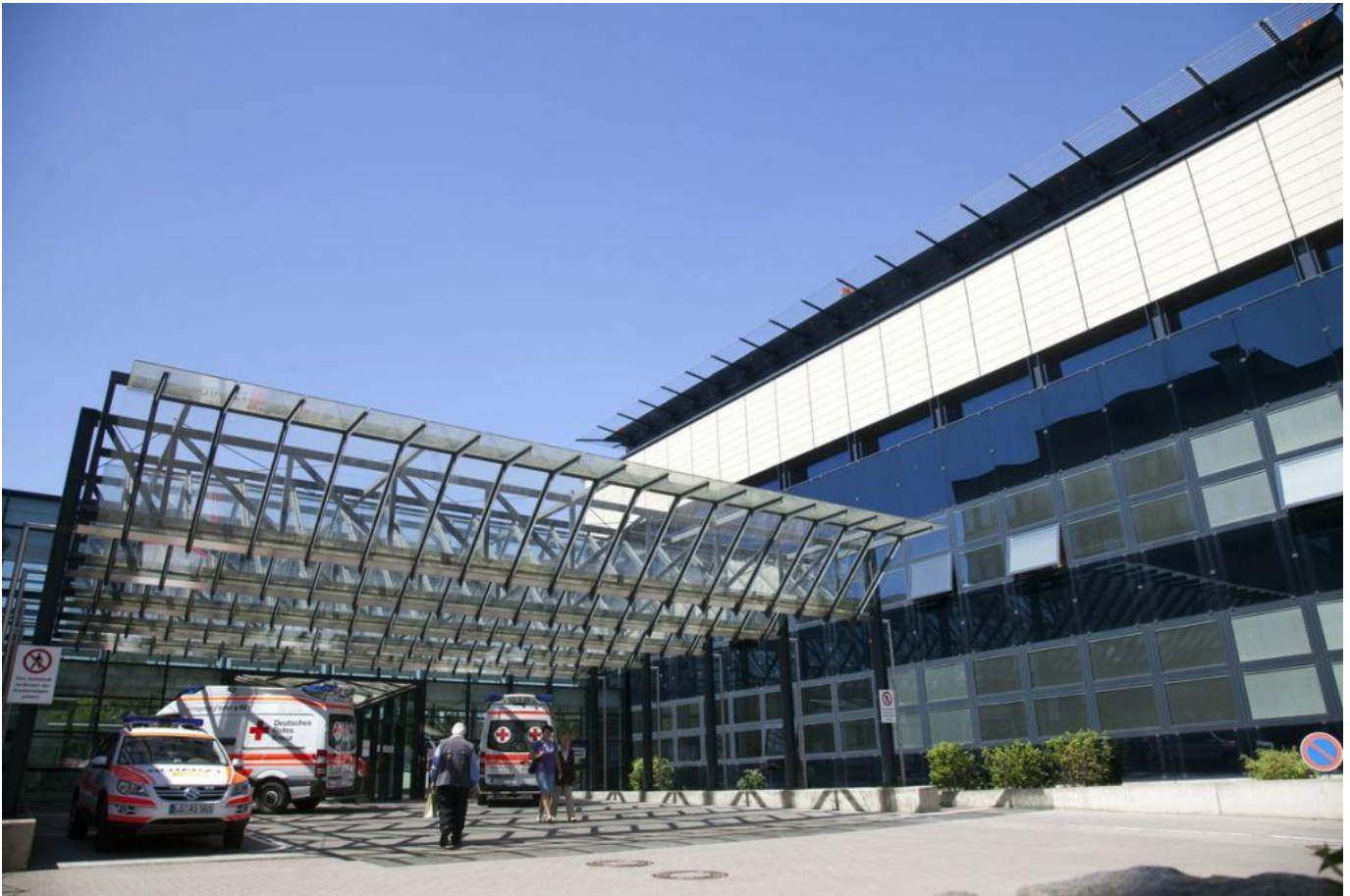
Abbildung: Haupteinfahrt Städtisches Klinikum Lüneburg gemeinnützige GmbH